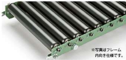
※写真はフレーム内向き仕様です。